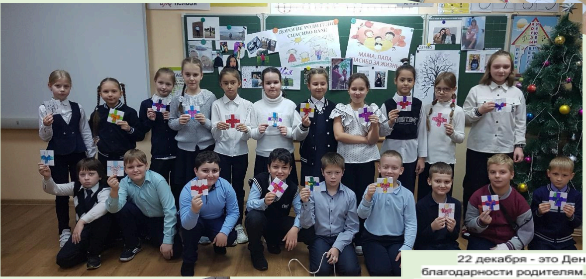
22 декабря - это День благодарности родителям. В этот день дети выражали свою глубокую признательность и благодарность своим родителям за все, что они сделали для них. Ученики 3 Г класса решили сделать «Дерево Благодарности» и открытку к празднику.