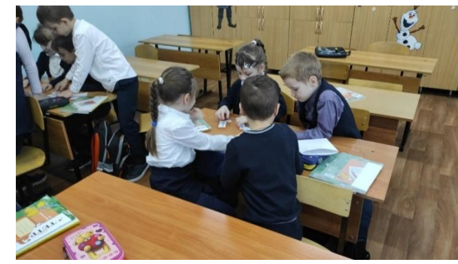
У нас получилось!