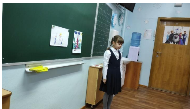
Моя мама воспитатель.