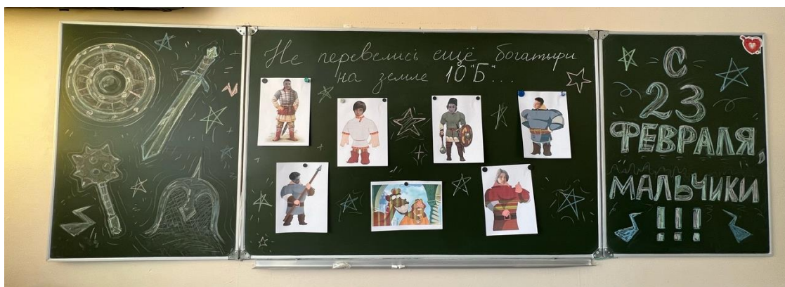
22.02 девочки 10Б поздравили мальчиков с Днём защитника Отечества. А затем все вместе отпраздновали середину масленичной недели – Лакомку!