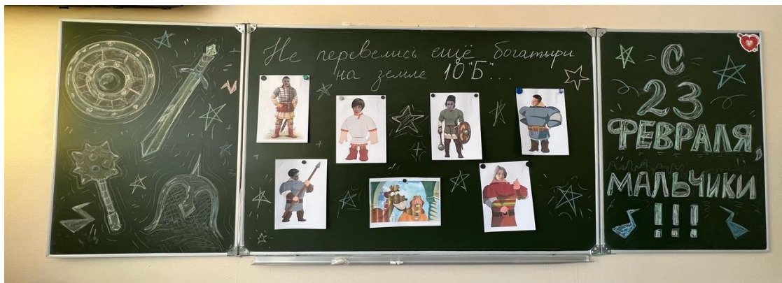
22.02 девочки 10Б поздравили мальчиков с Днём защитника Отечества. А затем все вместе отпраздновали середину масленичной недели – Лакомку!